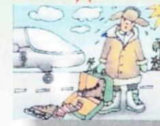
Резкое изменение природных условий