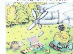
Вынужденное автономное существование

Выживание – активная целеустремленная деятельность, направленная на сохранение жизни, здоровья и работоспособности в условиях автономного существования.