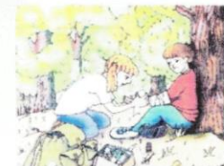
Заболевание или повреждение организма