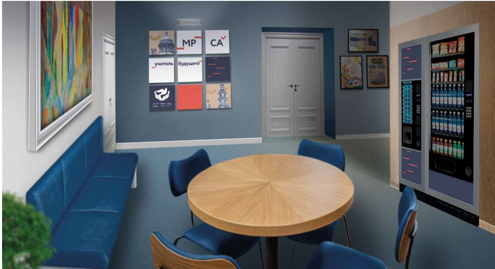
Зона отдыха. В концепции оформления объединяется проектная и региональная символика.