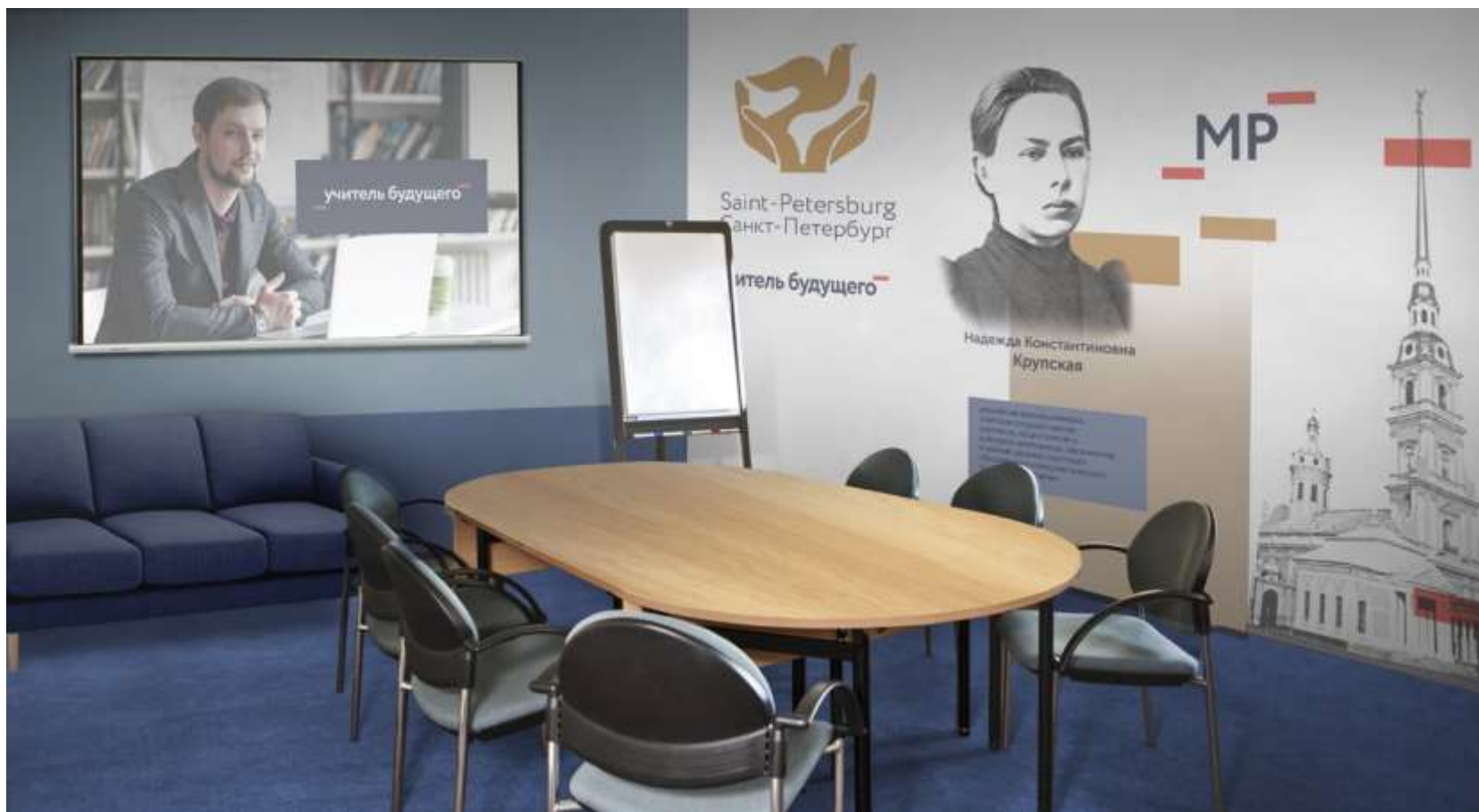
Помещение для проектной деятельности. В концепции оформления объединяется проектная и региональная символика.