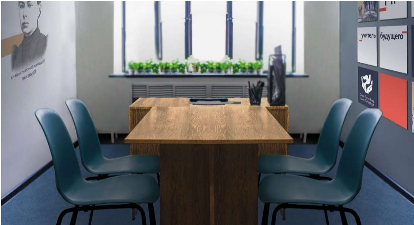
Рецепция. В концепции оформления объединяется проектная и региональная символика.