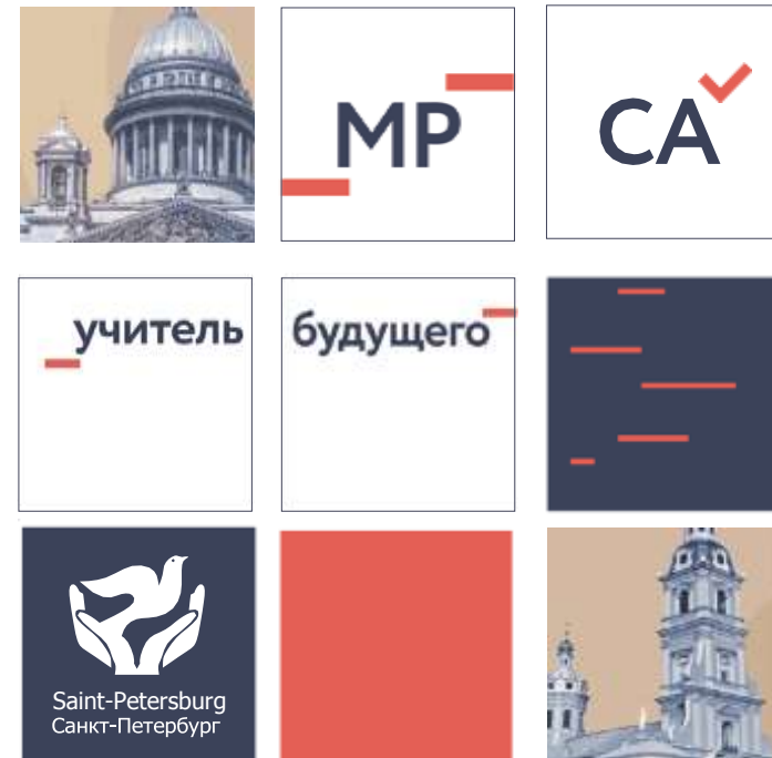
В концепции оформления объединяется проектная и региональная символика.