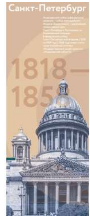
В концепции оформления объединяется проектная и региональная символика.