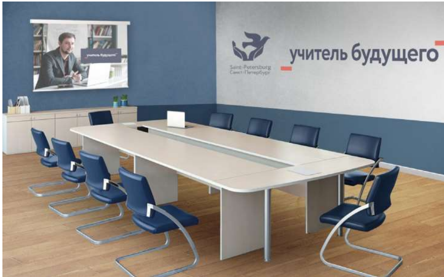
Медиатека. В концепции оформления объединяется проектная и региональная символика